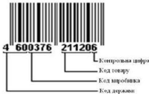
Рис. 1. Структура штрихової позначки EAN-13

Розглянемо елементи структури основного стандартного товарного коду EAN-13. На рис. 1 та 2 зображено структуру та номінальні розміри штрихової позначки EAN-13.