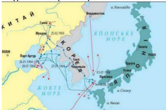
Японія в кінці ХІХ – на початку ХХ століття