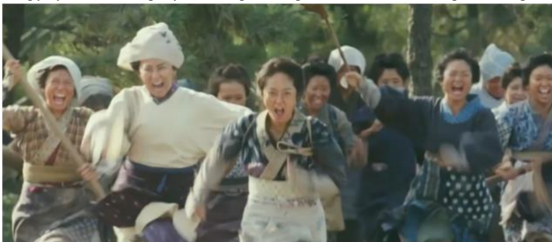
Фрагмент трейлера до фільму «Рисові бунти» (2021)

Ціни на харчі зросли в рази. Рис, якого не вистачало простому люду, став головним багатством. Ще в серпні 1918 року в Японії спалахують народні заворушення, так звані «Рисові бунти». Влада їх жорстоко придушує. Загострив становище японців Рут Бенедикт Японія в кінці XIX – на початку XX століття і землетрус у Токіо 1923 року, який приніс страшні людські та матеріальні втрати.