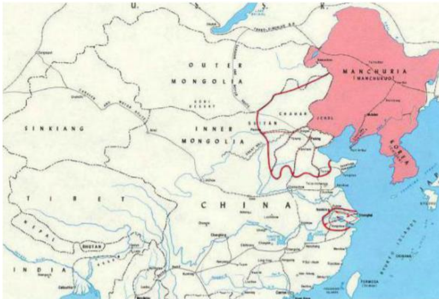
Карта Маньчжоу-Го, 1938 р.

Маньчжурію, власне, крім китайців, тоді ніхто Китаєм і не вважав. Тому світова спільнота заплющила на це очі. Плюс, Європа більше переймалася власними економічними проблемами, потрібно було вилазити з ями.