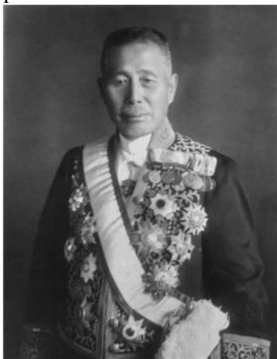
Генерал Танака Гііті

змалечку виховують у дусі зверхності над іншими народами. Найбільших обертів милітаризація набирає під час світової економічної кризи.