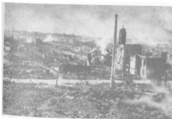
Токіо після землетрусу 1923 року

На зовнішній арені справи теж не дуже. Ані США, ані Британія не зацікавлені у зміцненні позицій Японії в Азії. Однак погоджуються, що співпрацювати з нею потрібно. Тому Японію визнають учасницею Вашингтонської мирної конференції. Одразу трьома договорами – «договір чотирьох», «договір п'яти» і «договір дев'яти» - Японію зрівнюють з потужними державами, але водночас обмежують її вплив у Азії, зокрема в Китаї, і зменшують флот.