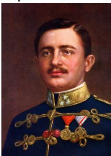
Карл I (IV) Габсбург

Гортівський і гітлерівський режими порозумілися і спільно чинили акти агресії в Європі, жертвою яких стала і Закарпатська Україна у 1939 році.