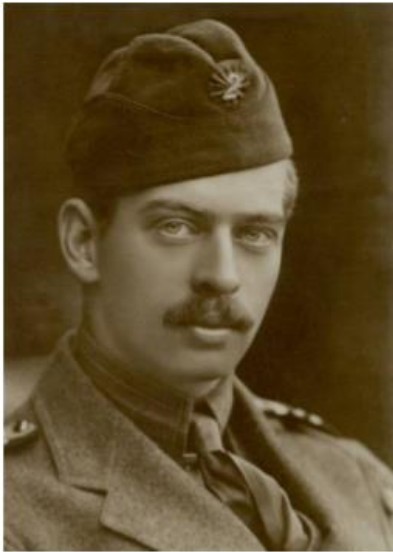
Король Кароль II

Світова економічна криза спровокувала нову хвилю внутрішньополітичних конфліктів, уряди постійно змінювали один одного, що лише послаблювало країну.