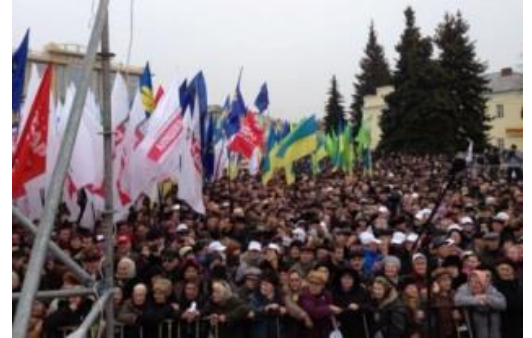
Акція "Вставай, Україно!" у Луцьку

Зовнішня політика. Прихід до влади Януковича ознаменувався поверненням до багатовекторної , а по суті проросійської зовнішньої політики. Вже 21 квітня 2010 р. президент РФ Д. Медведєв відвідав Харків, де було підписано угоду про знижку у сто доларів ціни на газ для України, взамін українська сторона погоджувалась продовжити термін дислокації ЧФ Росії до 2042 р., так звані Харківські угоди. Ще 2 квітня президент В. Янукович ліквідував комісію з підготовки вступу України до НАТО. Водночас Київський апеляційний суд заборонив проведення референдуму з питання вступу України до НАТО. 1 липня 2010 р. Верховна Рада ухвалила Закон України «Про засади внутрішньої і зовнішньої політики» , в якому наша держава визначається як позаблокова європейська держава.