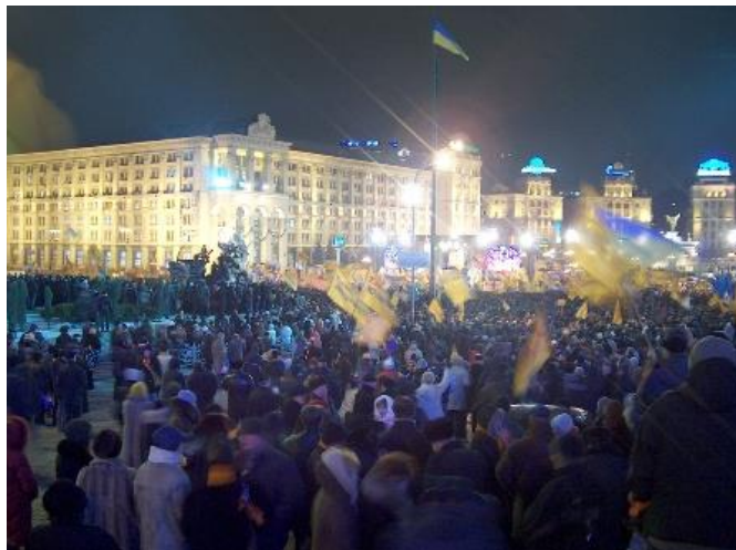
Перший день протестів на Майдані.

Майдан. Коли закінчувалось голосування, у Києві на Майдані Незалежності зібралось до 30 тисяч громадян. Вже 22 листопада їхня кількість зросла до 100 тисяч Лідери опозиції – В. Ющенко, Ю. Тимошенко, О. Мороз виступили перед мітингуючи і закликали відстояти втрачену перемогу. У скорім часі чимало вузів, шкіл особливо в західних областях, оголосили страйк, а студенти та учні щодня збиралися на майданах на мітинг. Ю. Луценко (польовий командир) оголосив, що у центрі Києва буде встановлено 1,5 тис. наметів. З цього часу він оголосив акцію громадянської непокори, став «польовим командиром». Так в Україні почалася помаранчева революція, оскільки кольором команди Ющенка був саме помаранчевий. Паралельно свій майдан організували прихильники Януковича, який поступався чисельністю. Особливістю протестного руху « біло-синіх » було те, що в умовах України він набирав ознак і регіонального.