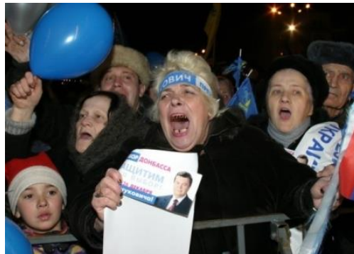
Протести прихильників В. Януковича.

Конституційна реформа. 8 грудня 2004 р. Верховна Рада України в пакеті ухвалила зміни до Конституції України, закон який вдосконалював систему проведення виборів. Припиняла свою діяльність діюча ЦВК і затверджувався склад нової ЦВК України. При голосуванні за відкріпними галонами на них ставився спеціальний штамп. Також Україна ставала парламентсько-президентською республікою. Передбачалося формування у майбутньому парламенті (з 2006 р.) парламентської більшості. Прем'єр-міністр призначається Верховною Радою за поданням Президента України, а кандидатуру прем'єра вносить Президент за пропозицією депутатської більшості у Верховній Раді. Міністр оборони, міністр закордонних справ призначається Верховною Радою за поданням Президента. Інші члени уряду призначаються Верховною Радою за поданням Прем'єр-міністра України. За Президентом зберігалось право дострокового розпуску Верховної Ради, якщо протягом 1 місяця не буде сформовано коаліцію депутатських фракцій, або за 60 днів не сформований склад уряду.