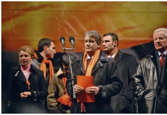
Лідери опозиції на Майдані.

Одразу після оголошення ЦВК результатів другого туру виборів, Ющенко звернувся до Верховного Суду України з вимогою визнати недійсними результати голосування по Донецькій та Луганській областях у зв'язку з масовими порушеннями народного волевиявлення. Вже 25 листопада Верховний Суд призупинив процес передачі влади новообраному президенту. Після багатьох днів протистояння Верховний Суд України визнав за необхідне провести третій тур виборів, який був призначений на 26 грудня.