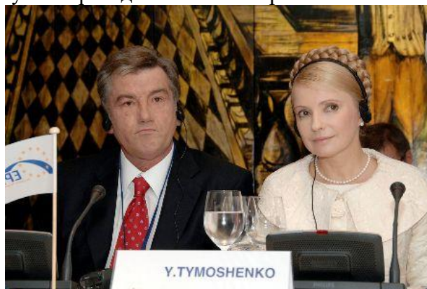
Президент та Прем'єр-міністр України, грудень 2007 р.

Проте це не змогло вирішити політичну кризу, конфлікт між парламентською коаліцією, яка завдяки «тушкуванням» збільшувалась та Президентом загострювався. Це дозволило Ющенку скористатись своїм конституційним правом та в квітні 2007 р. розпустити Верховну Раду України та призначити позачергові парламентські вибори . Після тривалих консультацій вибори були призначені на 30 вересня 2007 р. Результати були такими: Партія регіонів – 34,7%, БЮТ – 30,71%; «Наша Україна – Народна самооборона» - 14,15%; КПУ – 5,39%; Блок Литвина – 3,96%. В такій ситуації помаранчеві змогли домовитись і 18 грудня 2007 р. Прем'єр-міністром було призначено Юлію Тимошенко . Перед урядом постала серйозні труднощі в зв'язку з світовою економічною кризою. Водночас конфлікт між Президентом та Прем'єром лише загострювався, що не могло не позначитись на політичній ситуації в країні, поширеними явищами стали взаємні звинувачення Ющенко і Тимошенко у корупції. Це все посилювало розчарування людей в чинній владі, чим не могла не скористатись Партія регіонів , яка активно готувалась до реваншу на майбутніх президентських виборах.