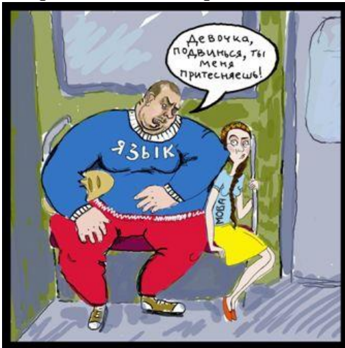
Карикатура на мовний закон 2012 р.

25 лютого відбулась інавгурація Віктора Януковича. З його приходом до влади розпочалась концентрація влади в руках Партії регіонів . Вже 11 березня 2010 р. у відставку було відправлено уряд Ю. Тимошенко, натомість уряд було сформовано Партією регіонів, які очолив Микола Азаров. Вже у вересні 2010 р. Конституційний суд визнав неконституційним Закон «Про внесення змін до Конституції України» від 8 грудня 2004 року № 2222-IV (політреформу 2004 року) у зв'язку з порушенням процедури його розгляду і ухвалення і відновив дію Конституції України 1996 року . Таким чином, Янукович отримав значно більші повноваження, а Україна знову стала президентсько-парламентською республікою .