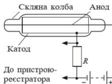
Будова газорозрядного лічильника (лічильника Гейгера — Мюллера)