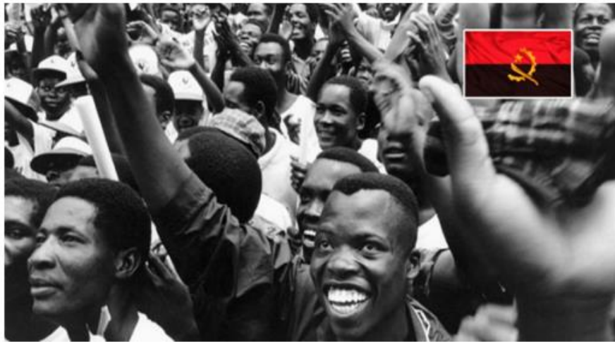
Революція в Португалії. Проголошення незалежності Анголи.

Під час четвертого етапу ( 1980—1990-ті рр. ) здобули незалежність останні колонії. У 1980 р. було остаточно врегульовано проблему Південної Родезії (Зімбабве): після громадянської війни між білим урядом і африканськими націоналістичними організаціями Велика Британія визнала незалежність Зімбабве. У 1982 р. британський уряд надав незалежність Белізу. У 1990 р. під тиском світової громадськості ПАР надала незалежність Намібії.