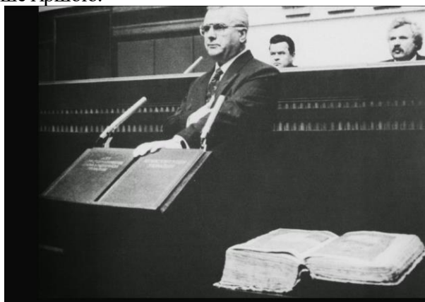
Присяга президента України Леоніда Кравчука

Переорієнтація на інші ринки потребувала часу і ресурсів. Ні того, ні того не було. Україна також не мала можливості згладити цей розрив доходами від продажу нафти і газу. Металургія, основа промисловості на той час, уже давно потребувала модернізації і сильно залежала від російського газу. Чим Росія неодноразово скористається. Водночас, Україна продовжила дотримуватися соціальних зобов'язань, достатньо високих ще за радянських часів. Держава тримала у своїй власності величезну кількість підприємств, що виїдали все більше коштів державного бюджету. Проте найголовніше — українські політики затягували з болючими, але потрібними реформами, що з кожним роком робило ситуацію лише гіршою.