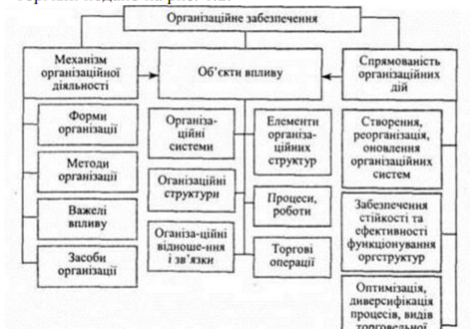
Рисунок 1.2 - Організаційна діяльність у сфері торгівлі

Організаційна діяльність має чітку спрямованість і свої особливості, які полягають у специфіці цілей, організаційних механізмів, характері дій, їх масштабності, кінцевих результатах. Разом з тим на практиці вона перетинається і доповнюється з управлінською діяльністю, зберігаючи при цьому свій зміст і характер як самостійний від діяльності.