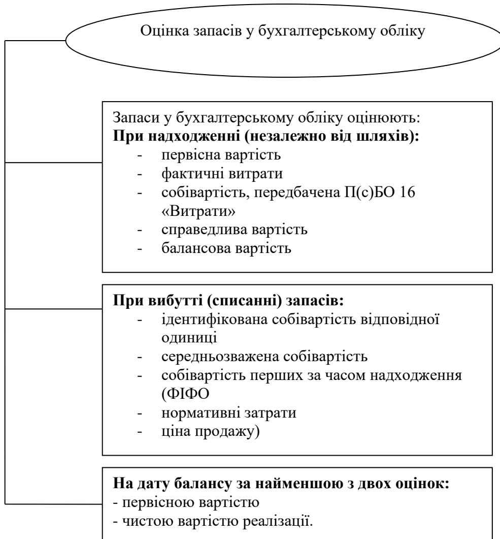
Рис.2. Оцінка запасів у бухгалтерському обліку