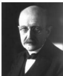
Рис. 33.2. Макс Карл Ернст Людвіг Планк (1858–1947) — видатний німецький фізик-теоретик, засновник квантової теорії — сучасної теорії руху, взаємодії та взаємних перетворень мікроскопічних частинок