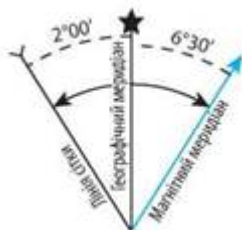
Мал. 1. Взаємне положення меридіанів на топографічних картах.

За основний вихідний напрямок береться напрямок географічного меридіана. На схемах взаємного положення меридіанів, розміщених на топографічних картах, його позначають зірочкою, магнітний меридіан — прямою стрілкою, осьовий меридіан — зворотною стрілкою (мал. 1).