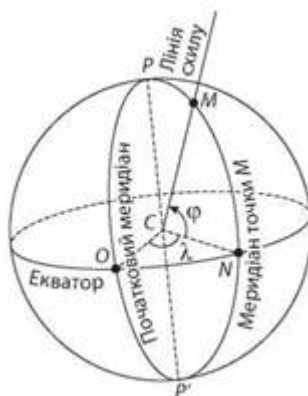
Мал. 1. Географічні координати.

Географічні координати відображають положення об'єкта або точки на місцевості (карті) відносно екватора (широта) і початкового меридіана (довгота) (мал. 1).