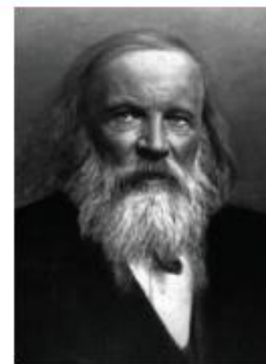
Дмитро Менделєєв (1834—1907)