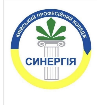
видається з вересня 2019 р.