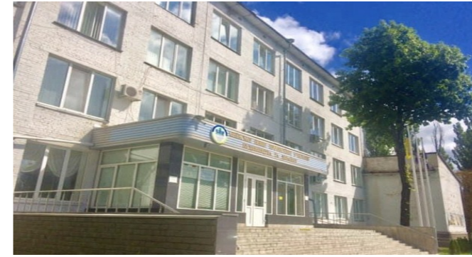
газета Київського професійного коледжу «Синергія»