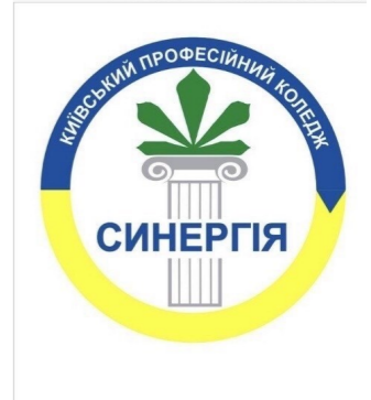
видається з вересня 2019 р.