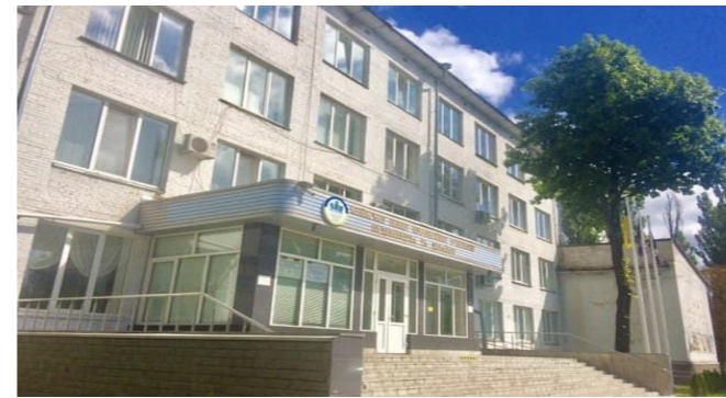
газета Київського професійного коледжу «Синергія»